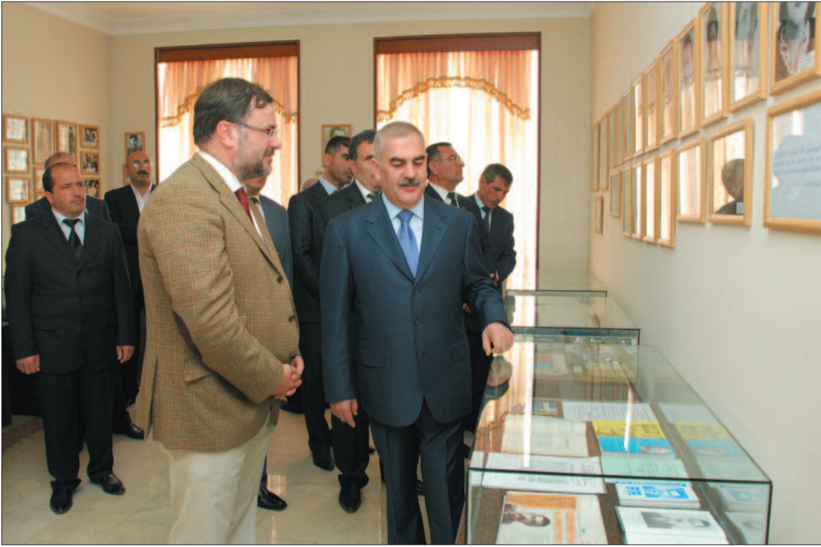
Şahtaxtinskilər Muzeyinin açılışında