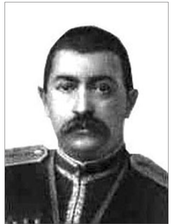
Əbülfət ağa Şahtaxtinski